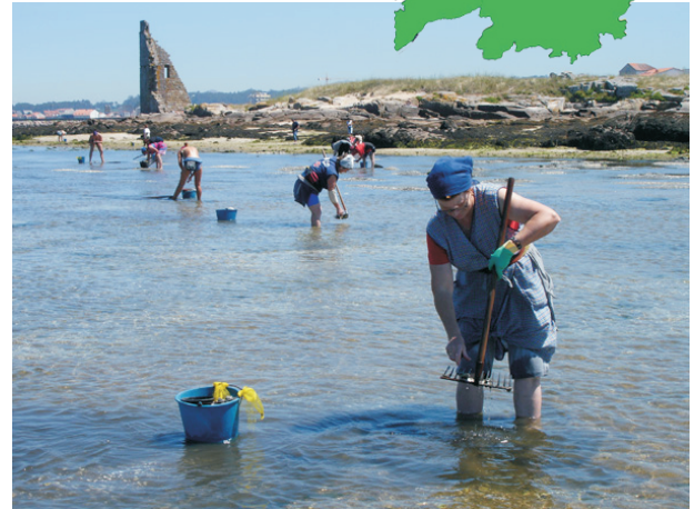
Mariscadoras ao pé da Torre de San Sadurniño

Desde Cambados séguese o paseo marítimo ata a Torre de San Sadurniño, onde comeza e remata a ruta.