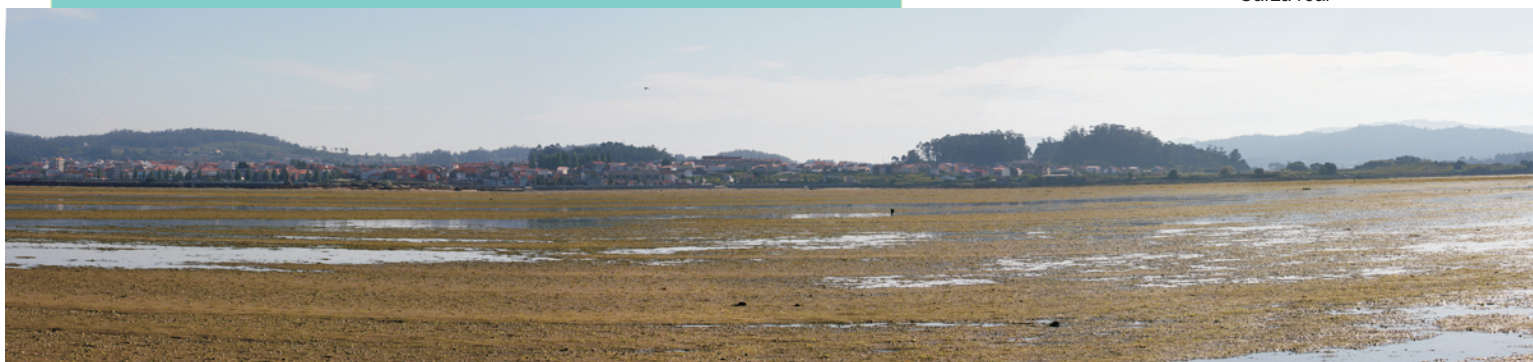
Vista do Serrido desde o punto máis lonxe da ruta. Ao fondo Cambados.