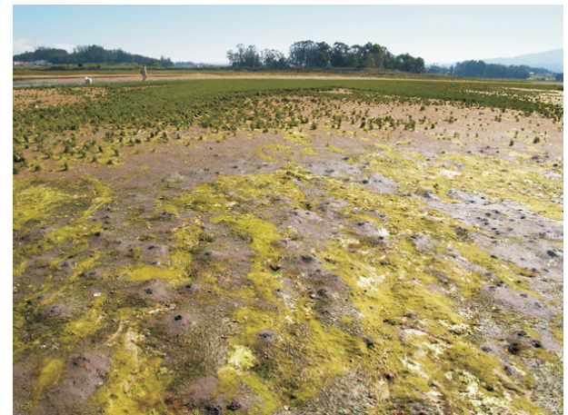
Ao fondo a Punta de Espiñeiro, na desembocadura do Umia.